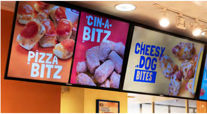
Signalétique Bretzels de Wetzel.